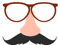
gafas con bigote