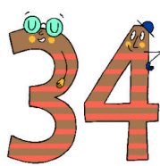
treinta y cuatro