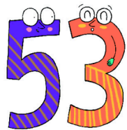
cincuenta y tres

Los números del 31 al 99 se escriben con tres palabras, excepto las decenas. La segunda palabra siempre es y .