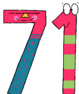
setenta y uno