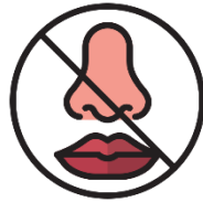
Pérdida de olfato o gusto